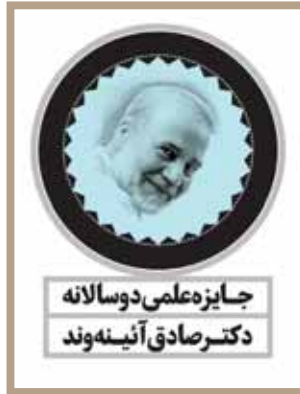
جایزه علمی دوسالانه دکتر صادق آئینه‌وند